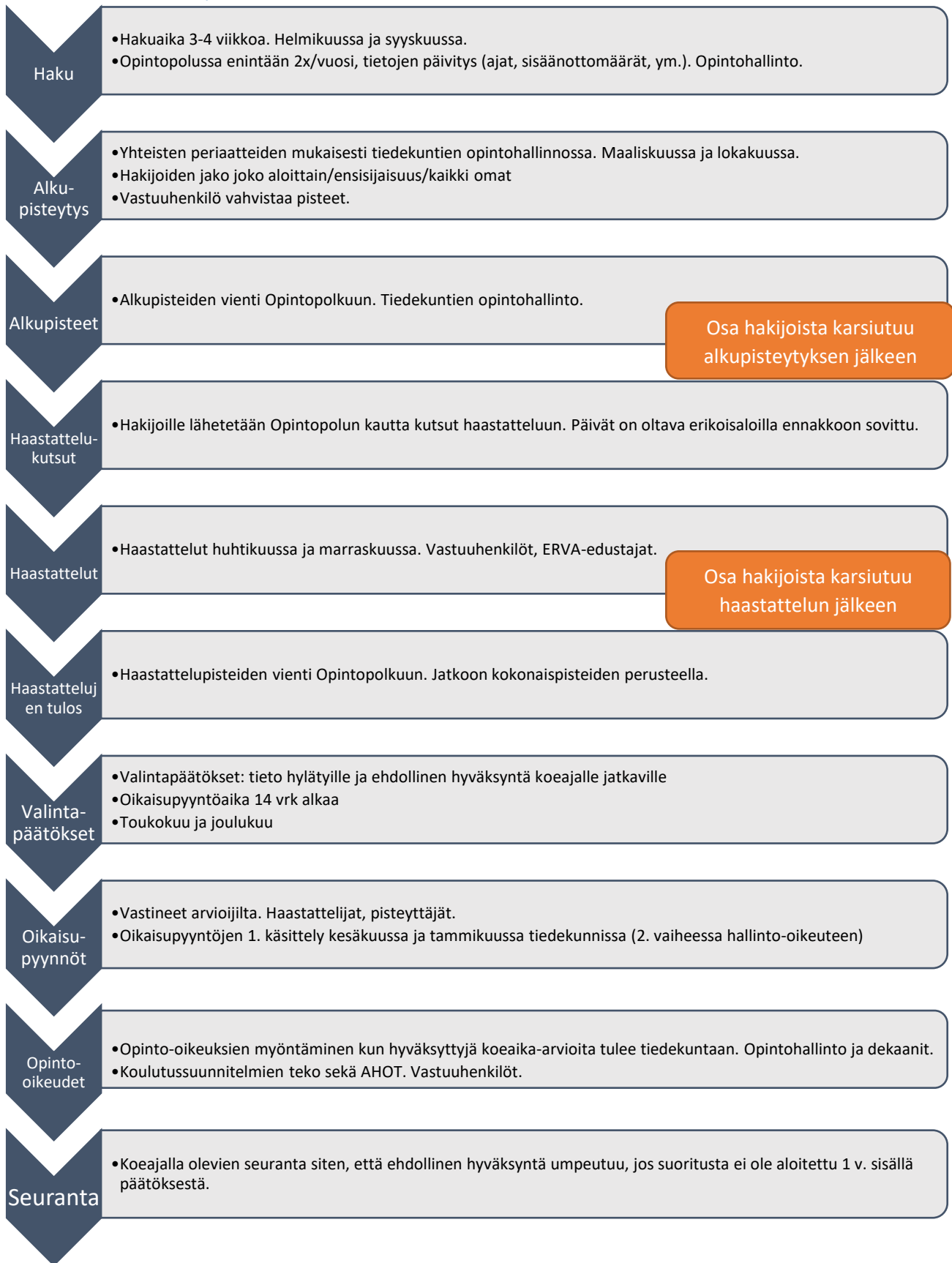
Kaavio 3: Valintamenettelyn kokonaisuus, tehtävät ja toimijat.